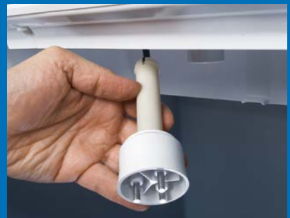
Wassersonde mit Schnappverschluss