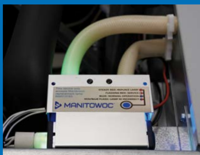
LuminIce® II UV-Hygiesystem

* bei einer Reinigung pro Jahr weniger über eine Lebensdauer von 10 Jahren