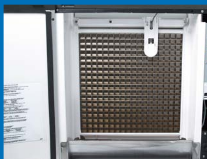
Nach vorne gerichteter Verdampfer