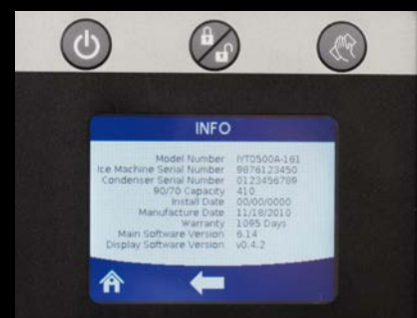
Maschineninformationen mit einem Tastendruck