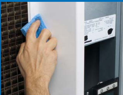
Abgerundete Ecken im Lebensmittelbereich