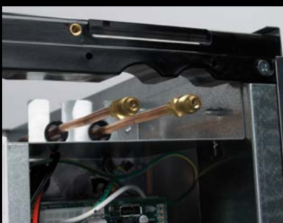
Praktische nach vorne gerichtete Serviceanschlüsse