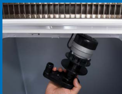
Wasserpumpe mit Schnappverschluss