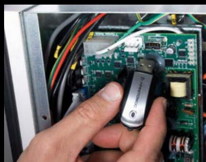
Updates über den USB-Anschluss