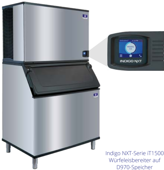
Indigo NXT-Serie iT1500 Würfleisbereiter auf D970-Speicher

Die präventive Diagnose des Würfleisbereiters der Indigo NXT-Serie wurde für Anwender entwickelt, die wissen, dass Eis für ihr Geschäft von entscheidender Bedeutung ist. Die Maschine überwacht sich selbst und sorgt dabei für eine zuverlässige Eisproduktion. Verbesserungen in der Reinigbarkeit und Programmierbarkeit erleichtern die Anschaffung und Bedienung Ihres Eisbereiters.