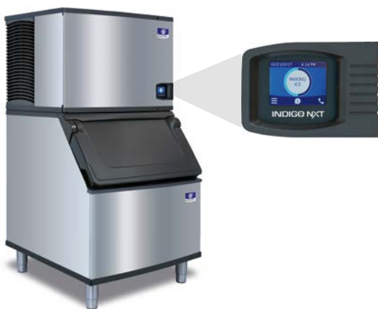
Indigo NXT-Serie iT0450 Würfeleisbereiter auf D400-Speicher

Die präventive Diagnose des Würfeleisbereiters der Indigo NXT-Serie wurde für Anwender entwickelt, die wissen, dass Eis für ihr Geschäft von entscheidender Bedeutung ist. Die Maschine überwacht sich selbst und sorgt dabei für eine zuverlässige Eisproduktion. Verbesserungen in der Reinigbarkeit und Programmierbarkeit erleichtern die Anschaffung und Bedienung Ihres Eisbereiters.