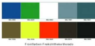
Frontfarben Freikühltheke Merado