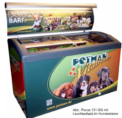
Abb.: Focus 131 GG mit Leuchtaufsatz im Kundendekor