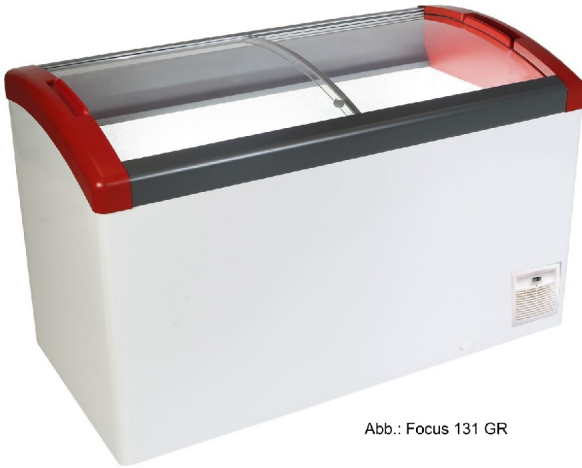
Abb.: Focus 131 GR

Eiscreme u. Verkaufstruhe Focus 151GRv2 - Esta Artikelnummer: 15534