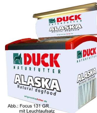
Abb.: Focus 131 GR mit Leuchtaufsatz