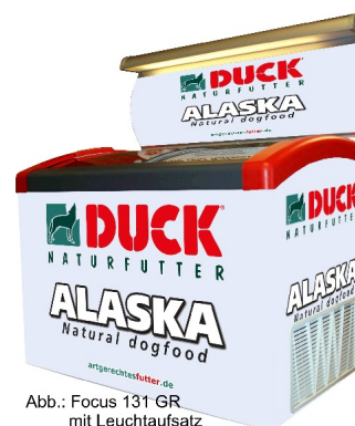
Abb.: Focus 131 GR mit Leuchtaufsatz