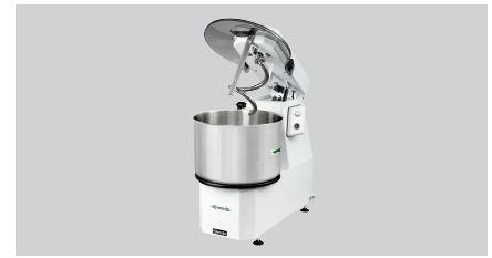
▶ Produktionsmenge: 38 kg / 42 Liter