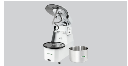
▶ Mit Schwenkopf und abnehmbarer Schüssel