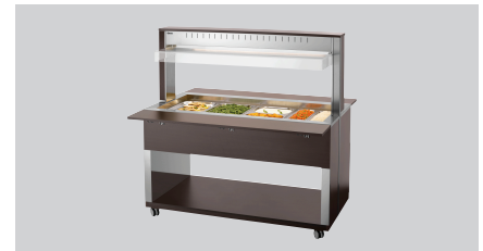
► Buffetwagen für warme Speisen