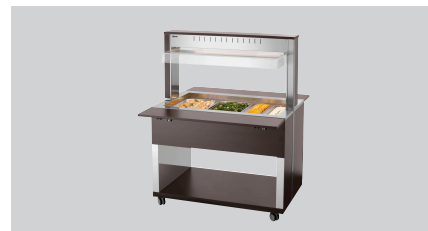
► Buffetwagen für warme Speisen