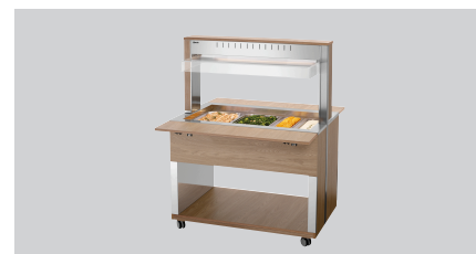
► Buffetwagen für warme Speisen