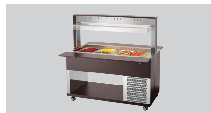
► Buffetwagen für kalte Speisen