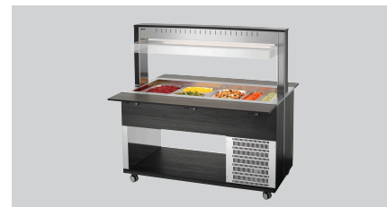
► Buffetwagen für kalte Speisen