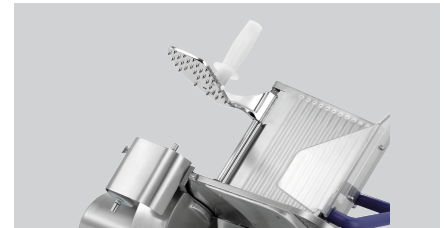
► Effizienter Restehalter