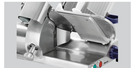
► Saubere Aufschnittführung