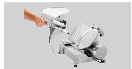
► Einfache Reinigung