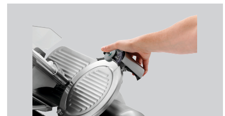
► Praktischer Messerschärfer