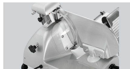
► Saubere Aufschnittführung