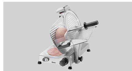
► Ausgelegt für Wurst