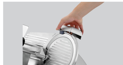
► Praktischer Messerschärfer