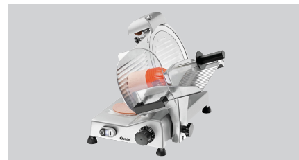
► Ausgelegt für Wurst