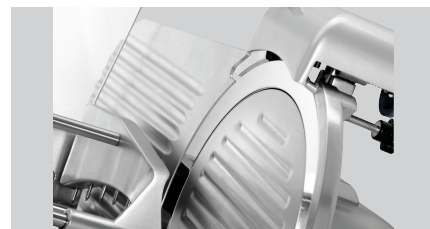
► Zweifacher Messerschutz