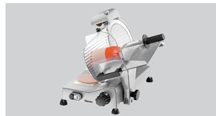
► Ausgelegt für Wurst