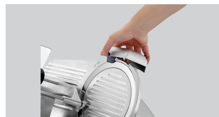
► Praktischer Messerschärfer