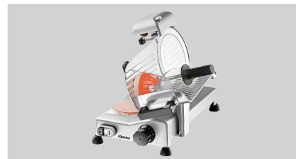
► Ausgelegt für Wurst