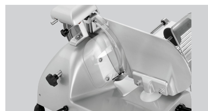
► Saubere Aufschnittführung